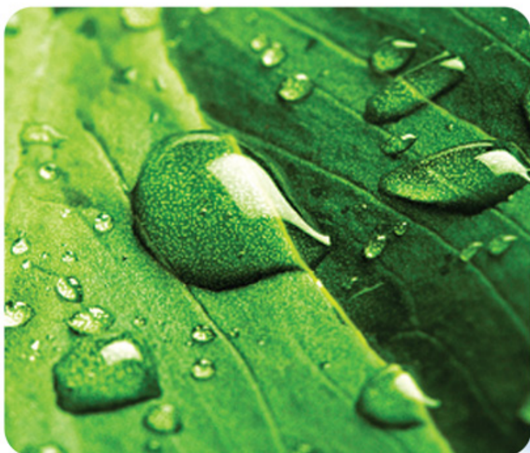
Faktu lapa izstrādāta 2009.gada jūnijā.

Sākotnējais publiskais piedāvājums tika sagatavots aptuveni 5 mēnešu laikā.